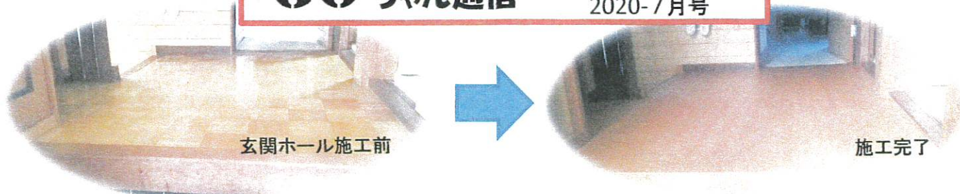
玄関ホール施工前